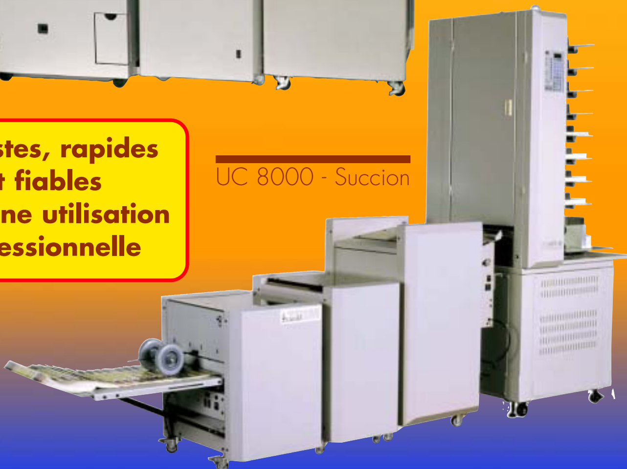
UC 8000 - Succion

Robustes, rapides et fiables pour une utilisation professionnelle