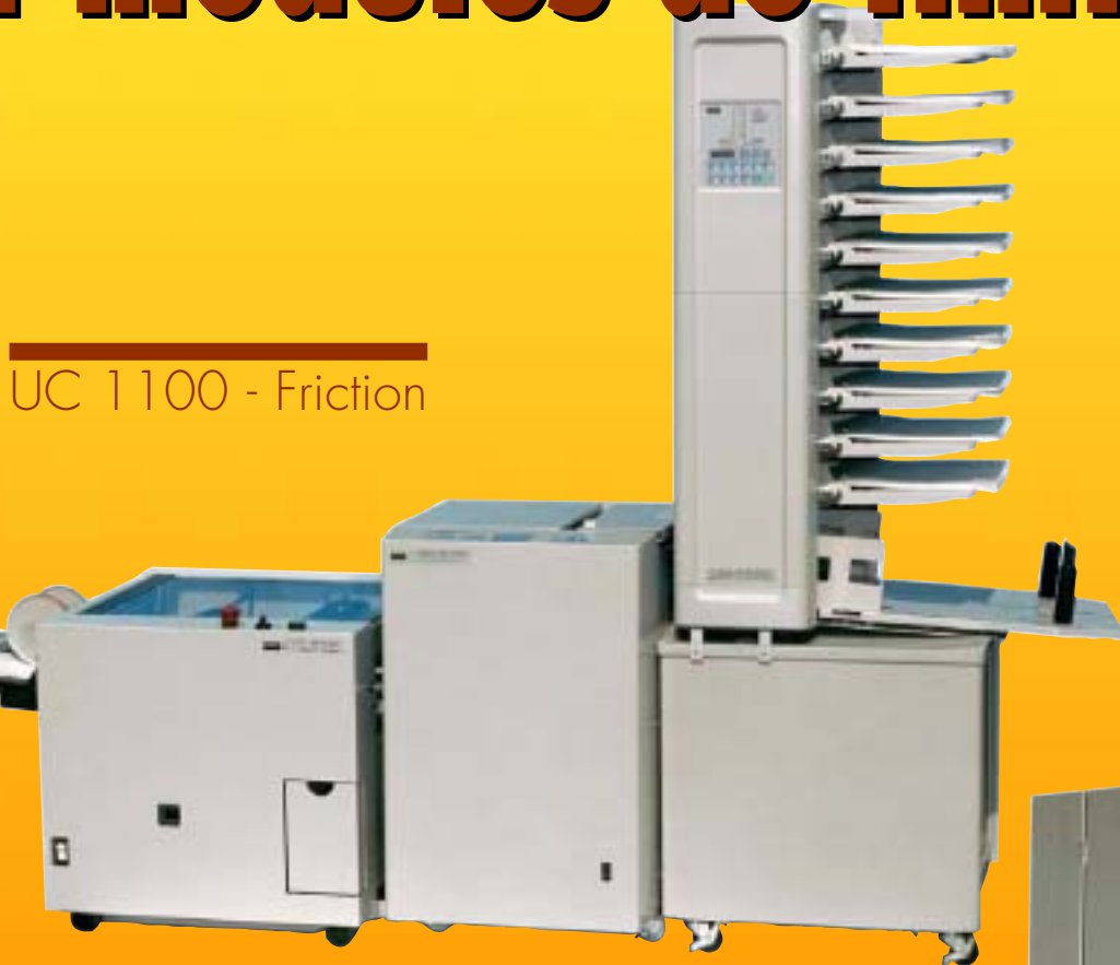
UC 1100 - Friction

Robustes, rapides et fiables pour une utilisation professionnelle