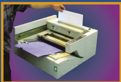
Mettre les feuilles dans le chariot