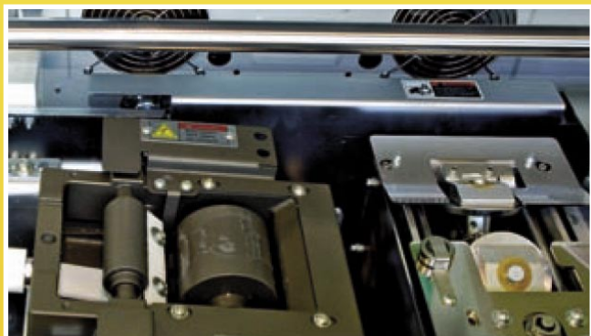
Bac polyuréthane téflonné

Maintenance réduite grâce à la technologie pneumatique.