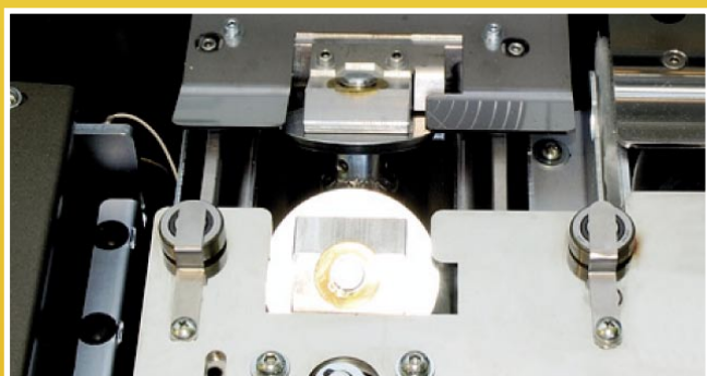
Bac EVA pour collage latéral