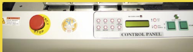
Tableau de commandes